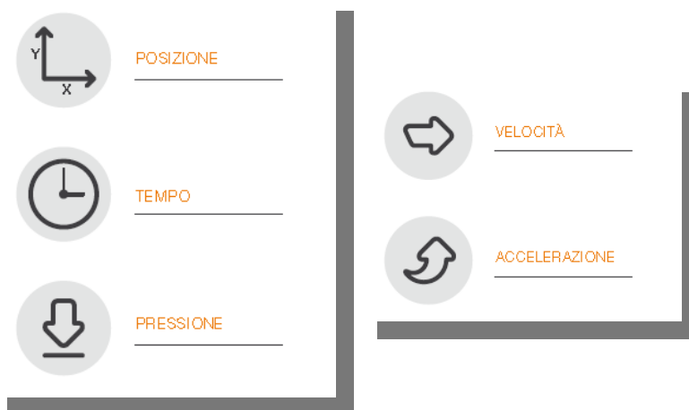
Fig.1 - Schema

E' possibile elaborare velocità e accelerazione ai fini di analisi forensi.